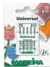
Art. No. 9450