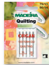
Art. No. 9454